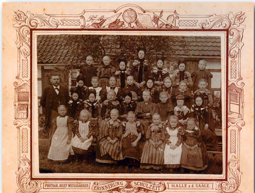
Letelner Schülerinnen etwa 1895 vor der alten Fachwerkschule an der Großen Trift