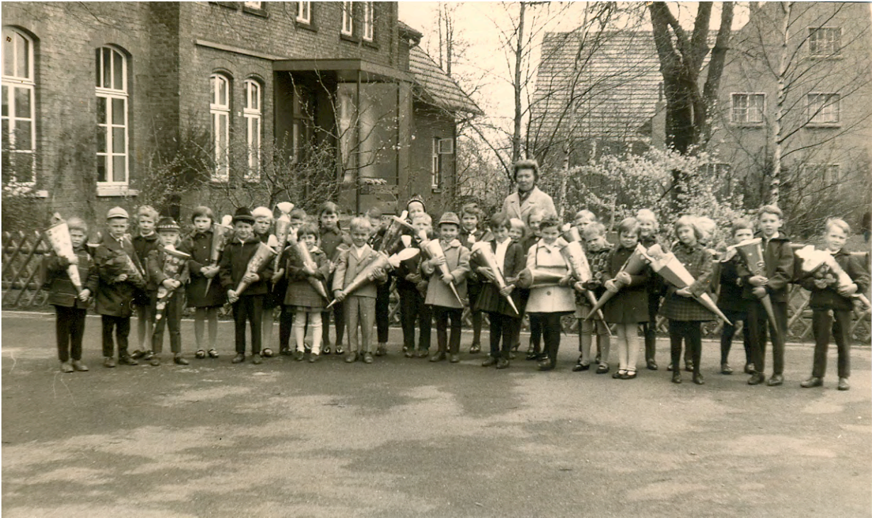
Schulfoto vom April 1965, im Hintergrund das Lehrerwohnhaus und der Hof Schildmeyer Nr. 22 (Prangen)