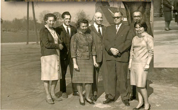
Schulfotos und Fotos von der Schule in Leteln