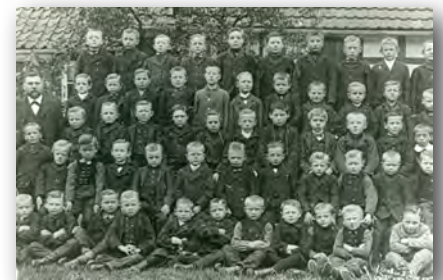
Letelner Schüler von etwa 1895